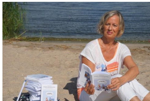
Steno lesen macht Spaß und hält fit